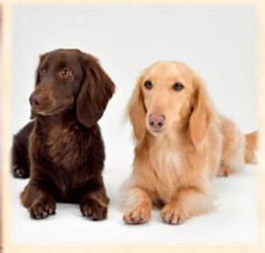
ペットとのご入居OK