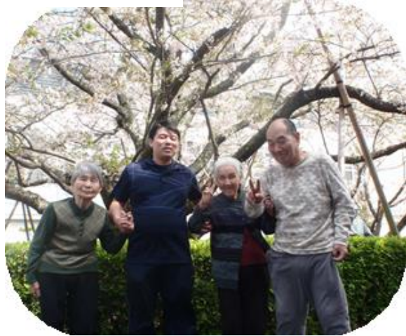
三浦美術館へお花見に出かけました。 はい ピース 🍷